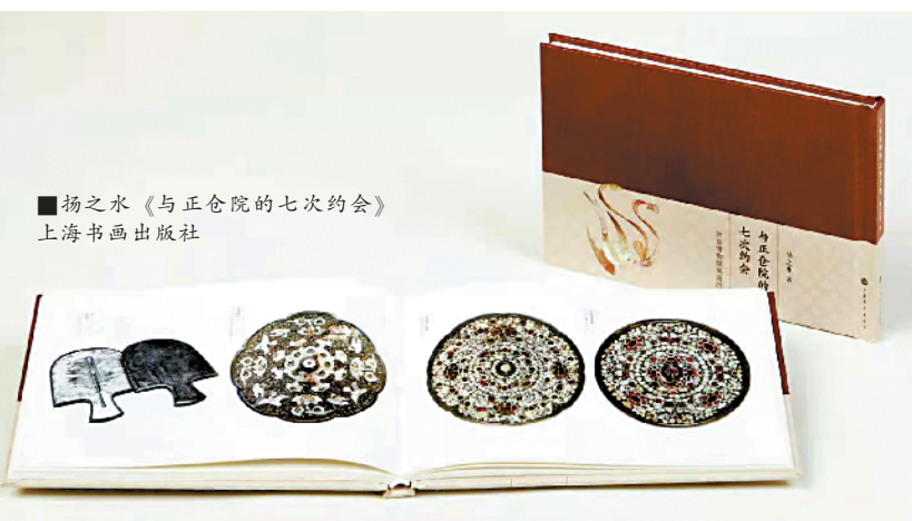
■扬之水《与正仓院的七次约会》上海书画出版社

包含作品全貌与局部放大细节,并使用高级特种涂层艺术纸,最大限度还原正仓院的精美文物。(潘玮倩)