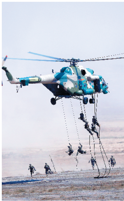
■运输直升机搭载陆军特战小队至预定区域，特战队员实施索降。新华社发