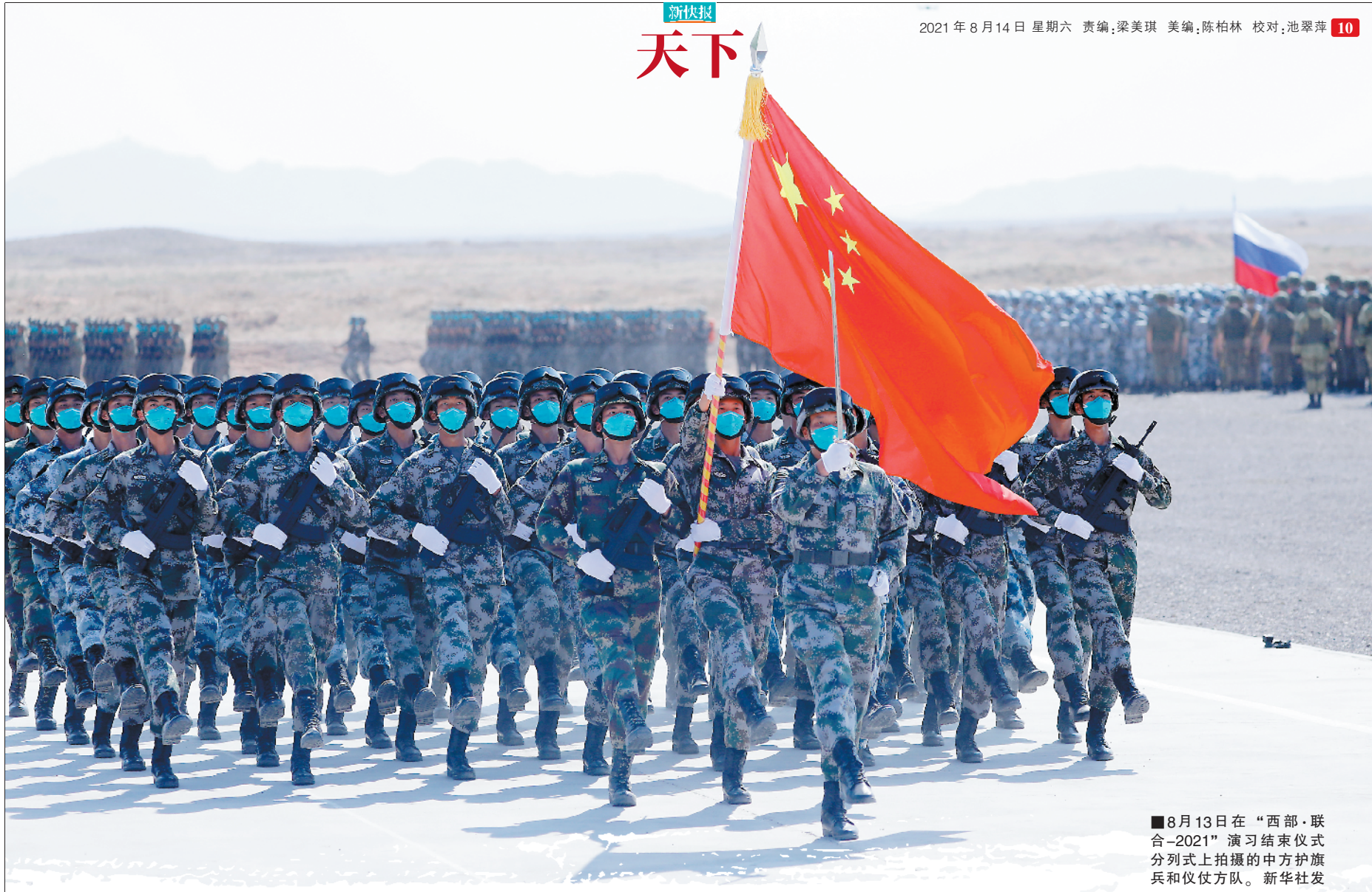
■8月13日在“西部·联合-2021”演习结束仪式上拍摄的中方护旗兵和仪仗方队。