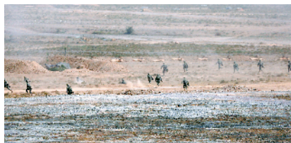
■陆军特战队员从直升机索降着陆后实施精兵破袭。