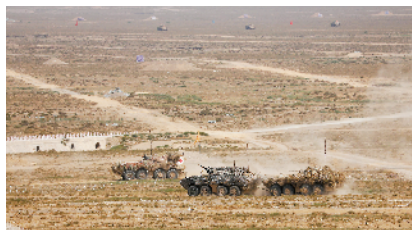
■后装保障群装甲抢救车转移“故障装备”。