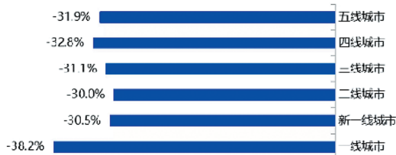
教培从业者求职人数逐月环比增速