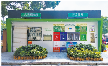
■天河区长兴街城中村建成的板房式两网融合点。

新快报讯 记者朱清海报道 人人避之唯恐不及的垃圾投放点,变成小区添色的一道风景。近日,新快报记者从天河区城市管理和综合执法局获悉,天河区扎实推进环卫系统与再生资源系统“两网融合”,通过推行公房式、板房式、扩容式三种建设模式,已建成80多个两网融合点,有效解决环卫工具存放和资源回收点不足的问题,形成了环卫和供销两个系统宣传教育协作、回收清运互通,规划布点融合、设施设备共享的“两网融合”长效机制,实现1+1>2的社会效益,让分类产生价值,让垃圾变成资源。