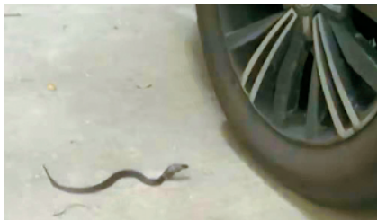
■业主在小区发现蛇蜕,捉到小蛇和大蛇。