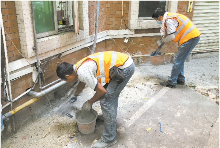
■大龙街道联合相关职能部门对东景园进行排查整治。