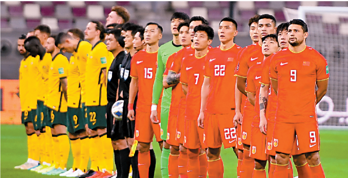
■12 强赛才刚刚起步，国足不要因为一场失利而丧失信心。

在 12 强赛分组抽签揭晓之时，记者就曾撰文表示，国足想要冲击世界杯正赛，大概需要 17 个积分，整个征程中队伍是有可以试错的空间的。只要摆正心态，及时总结，球队还是有很大希望重新回到正常轨道。