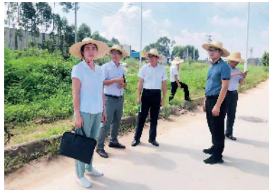
■工作队在大沙镇调研。