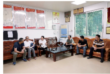
■工作队联系村干部入村了解情况。