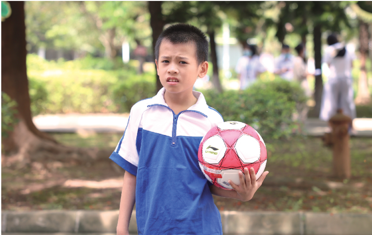
■运动时间，“白云松”刚到操场就抱起一个足球。

记者了解到，2021年5月30日8时许，警方在接到群众报警后，迅疾赶往广州市白云区松洲街东旺市场，发现这个在外流浪的男孩，在进行了14天健康医学观察和核酸检测后，将他安全送入广州市未成年人救助保护中心（简称“未保中心”）接受救助保护。