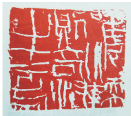
■沃兴华 唯泥软则奇怪生焉