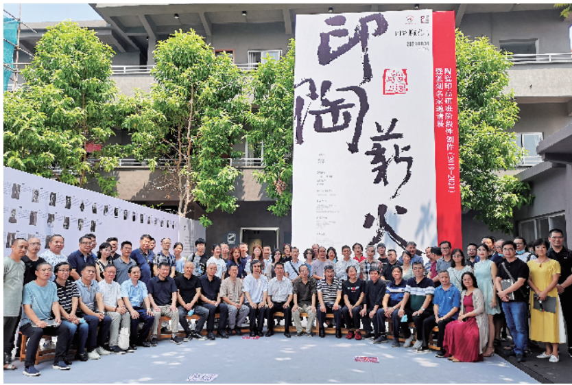
■“印陶薪火—陶瓷篆刻名家邀请展”在顺德勒流黄连画家艺术村开展。

据《汉书·祭祀志》载:“自五帝始有书契,至于三王,俗化雕文,诈伪渐兴,始有印玺,以检奸萌”。刻印章起源甚早,在人们利用铜、玉、石、木等材料制作印章之前,先祖早就有了用陶瓷为印的行为。中国古代的陶印技术,最早可追溯到八千年前的河南舞阳贾湖新石器遗址所出土的陶印模。陶器上压印出的线条、块面图纹,被称为“陶瓷印”、“封泥印”。这种具有印章功能的陶拍的产生,无疑堪作印章的最初形态。早在先秦、秦汉时期所使用的陶质器物上留下的花纹、早期的文字、以及后来的封泥、瓦当等等,可以视为后来陶瓷印章的先驱。陶瓷印是“陶印”和“瓷印”的统称,其制作分为制坯