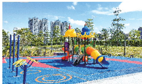
■从化大桥口袋公园。