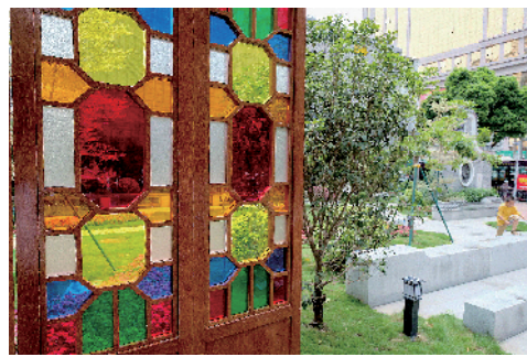
■荔湾区康王路口袋公园处处洋溢着岭南味。

记者在荔湾区政府官网查询发现,荔湾区发展和改革局今年3月发出了对《2021年荔湾区口袋公园(邻里花园)建设工程项目立项》的复函。复函提出,同意荔湾区口袋公园(邻里花园)建设工程项目,计划总投资230万元,在荔湾区镇安路公共绿地等地建设3-5个口袋公园,建设规模总面积约4000平方米。