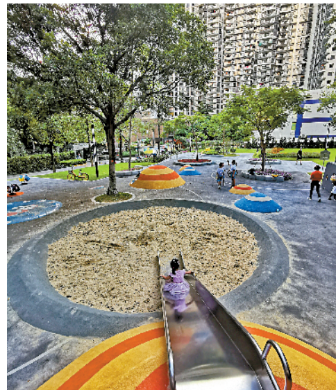
■天河区金穗幼儿园旁绿地口袋公园。

新快报记者了解到，今年6月，天河区上新了14个口袋公园，金穗幼儿园旁就是其中一个。据天河区住建园林局透露，该区将合理规划，进一步将闲置绿地利用起来，打造城市生态系统的绿色微单元，实现每个社区250米范围内至少1个口袋公园的目标，为市民提供极具人文关怀的多功能活动场地，以满足不同使用人群的需求。