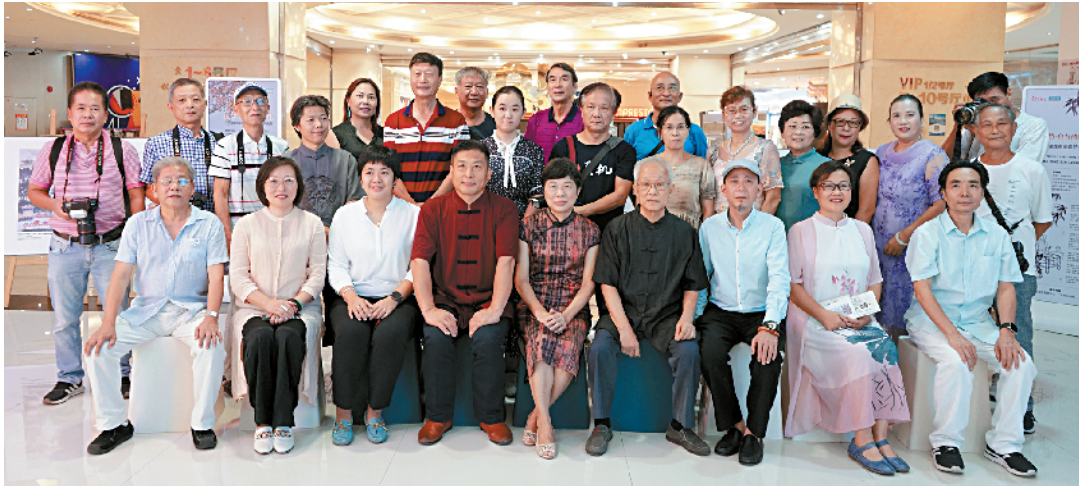
■“花儿朵朵向阳开 花城汇聚城花来”系列活动,将带来连场精彩展览。