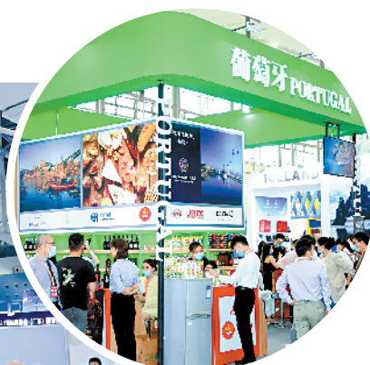
■葡萄牙展馆吸引了不少市民参观。