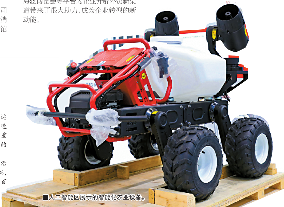
■人工智能区展示的智能农业设备。

今年1-8月,广东对“一带一路”沿线国家进出口1.31万亿元,增长20.9%,快于同期广东整体进出口增速1.3个百分点,占比进一步提升至25%。