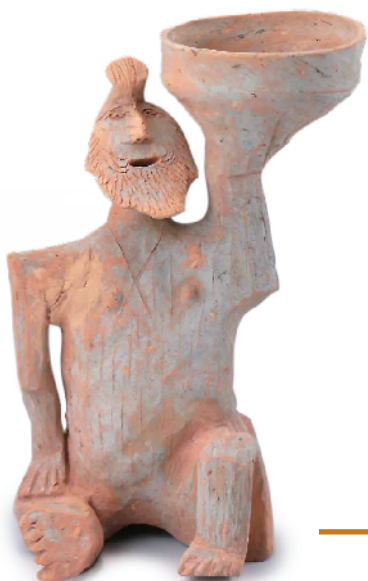
■陶胡人俑座灯“小宝”,出土于广州市先烈南路大宝岗西汉晚期墓(编号M5)。