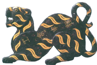
■错金铭文铜虎节,西汉南越王墓出土。