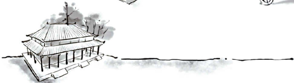
汉代 —— 南越王宫