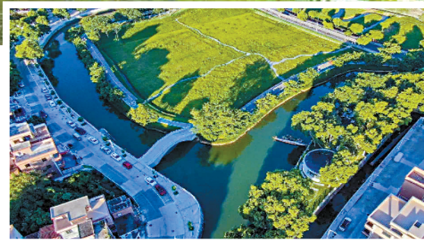
■大岭丫村水岸枫林。

道滘镇地处东莞市西部,是一座拥有近700年历史的岭南水乡古镇,全镇总面积54.3平方公里,下辖13个村、1个社区,常住人口约14万人,拥有“中国游泳之乡”“中国曲艺之乡”“中国民间文化艺术之乡”“中国特色食品名镇”“国家卫生镇”“省园林城镇”“省生态乡镇”“省教育强镇”“省森林小镇”“省文明村镇”等荣誉称号。