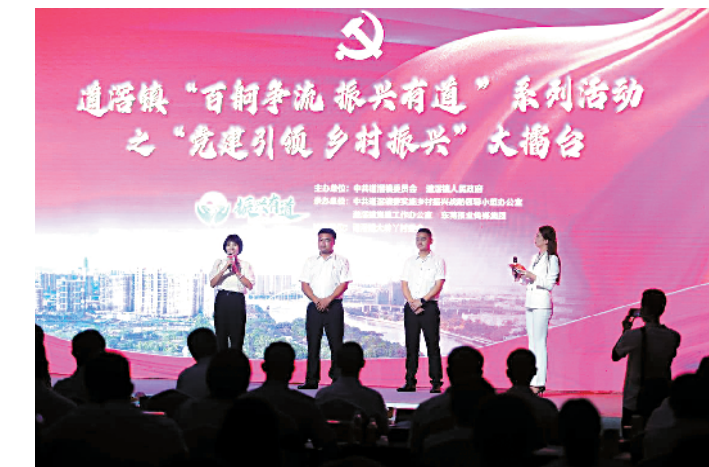
■“党建引领乡村振兴”大擂台。

值得一提的是,道滘党委以生态宜居为重点,以产业兴旺为核心,鼓励各村党组织充分挖掘自身资源,积极放大自身优势,先后推动形成了大岭丫村水岸枫林、南丫村掌洲岛、蔡白村北岛公园等形象标识及品牌项目。目前,道滘全域已建成干净整洁村和美丽宜居村。