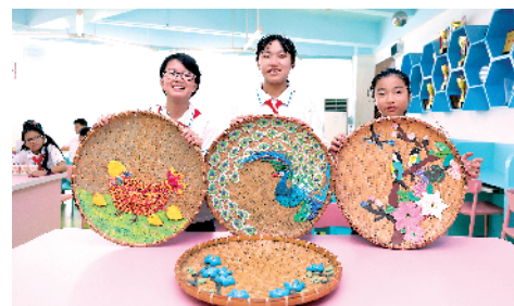
▲沙步小学手工兴趣小组以旧簸箕为主题的创意作品。