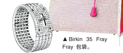
▲ Birkin 35 Fray 包袋。