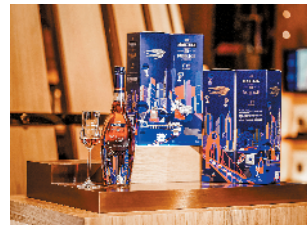
▲马爹利名士广州城市限量版。

干邑品牌马爹利日前在天河北广州ICC环贸天地正式揭开全球第二家马爹利干邑世家的面纱。店内设计以马爹利首席酿酒师的工作酒窖为灵感，生命之水、橡木桶等元素的陈列，加上随处可见充满古典奢华韵味的木质、铜质元素，细细诉说着时光沉淀中镌刻下的生命力量。