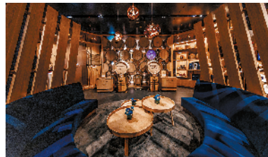
▲店内设计宛若在细细诉说着时光沉淀中镌刻下的生命力量。