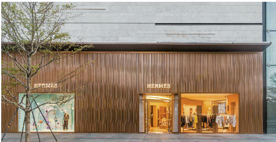
▲优雅灵动的外立面。

爱马仕深圳湾万象城专卖店日前全新开幕。这是爱马仕在深圳设立的第二家专卖店，同时也是中国内地第 25 家专卖店。