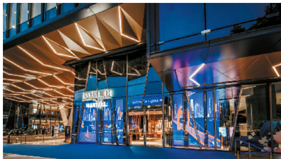
◀全球第二家马爹利干邑世家落户广州。