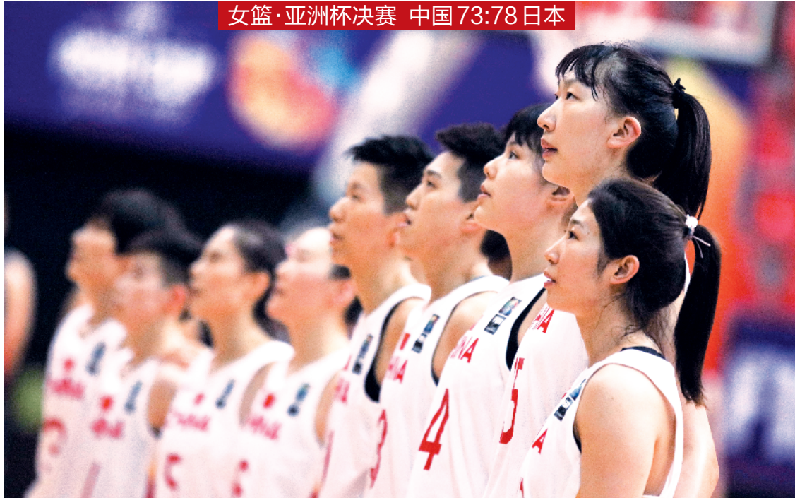
女篮·亚洲杯决赛 中国73:78日本