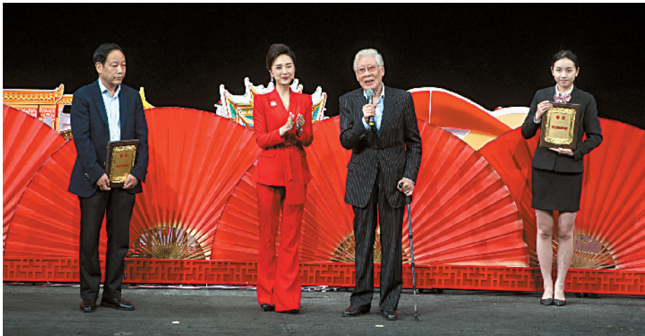
■10月9日,焦晃(右二)被授予中国文联终身成就戏剧家荣誉称号后发言。

中国戏剧节是一项全国性的戏剧展演活动,创办于1988年,每两年举办一次。本届中国戏剧节由中国文学艺术界联合会、中国戏剧家协会、中共湖北省委宣传部、武汉市人民政府共同主办。