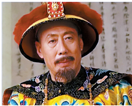
■焦晃曾在电视剧《雍正王朝》中出演康熙,深受观众喜爱。

个人的荣誉,我更愿意把它看作是对我在60年来、在不同创作集体中,与许多共同创作的伙伴们共同的肯定。我个人年纪大了,身体不好,但只要有可能,我还是愿意为中国的文化建设尽上一份心、出一把力。”