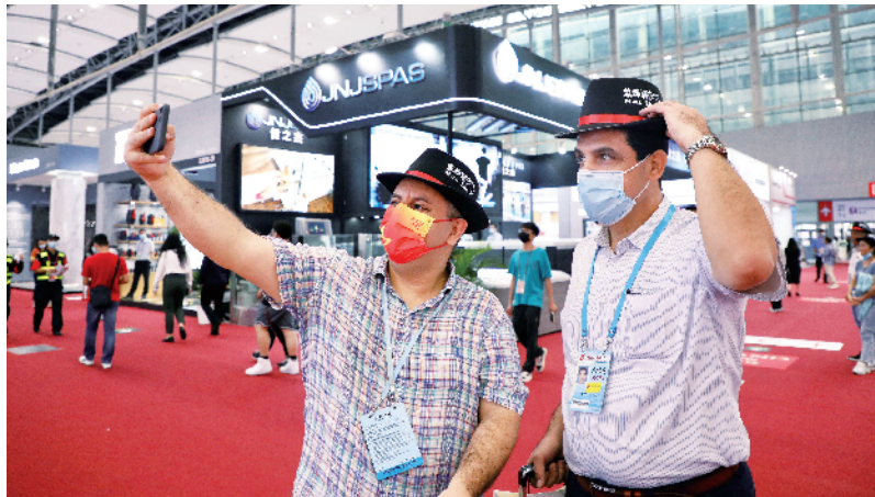
■ 拿订单、拓市场、创品牌,广交会向来是国内外企业们共享中国发展成果的重要平台。图为两位巴勒斯坦采购商在新能源专区自拍合影。 新快报记者 孙毅/摄

科沃斯自1998年成立后就开始参加广交会。科沃斯扫拖机器人和添可洗地机产品在国内外市场占有率均达到第一,其中在家用服务机器人领域核心组件国产化率已达95%。姜水英介绍,企业将推动“三个坚持”。第一是坚持做好产品导向,不停洞察用户需求,满足用户痛点进行研发;第二是坚持研发和创新的效率;第