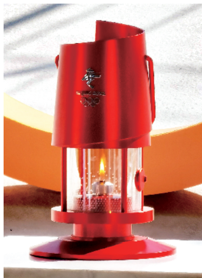
在奥林匹克塔穹顶展出的北京冬奥会火种灯。