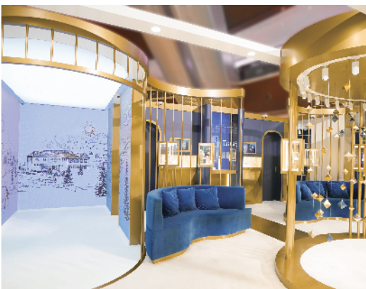
▲展厅布置既典雅贵气,又不乏现代感。