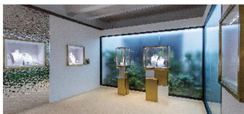
▲“意象释放”主题展区

继首度亮相意大利科莫湖畔后,卡地亚全新SIXIEME SENS PAR CARTIER 高级珠宝日前登陆上海,带来一场感官意象之旅。展览选址具有浓郁新古典主义建筑风格的上海百空间卜内门洋行,将持续至10月28日,展品包含全新SIXIEME SENS PAR CARTIER 系列在内共有460余件珠宝、腕表作品,无不展露高级珠宝的极致魅力。