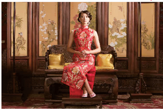
■唐光艳作品:《国色天香》