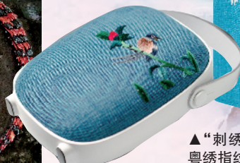
▲“刺绣智能3C”作品:粤绣指纹解锁手账。