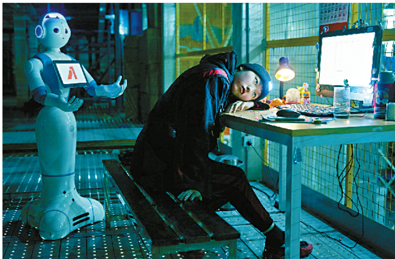
■《亚洲一号》单频高清影像,2.35:1,彩色,有声63分21秒