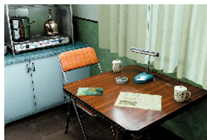
■《永不消逝的电波》作品与Acute Art联合制作 虚拟现实