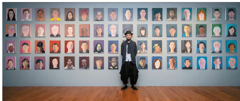
■童雁汝南及其作品

2021年10月22日,由广东美术馆主办,33当代艺术中心协办的“直面——童雁汝南作品展”在广东美术馆开幕。本次展览由王绍强担任展览总监,杨小彦担任策展人。