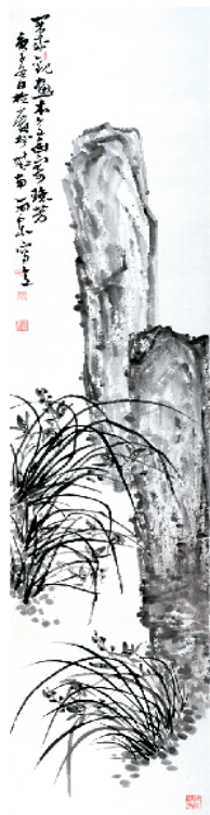
■邹雨东 花鸟六条 屏之二

触破坏画中风景,这种“消解”画面主体的行为,使作品所要表达的情感和意图走向对观念的诠释;岳海喜的这批作品,通过朦胧的笔法、独特的视角使画中物象处在一种真实与虚幻之中,如同凝固时间与空间的画面处理令人无限遐想。(潘玮倩)