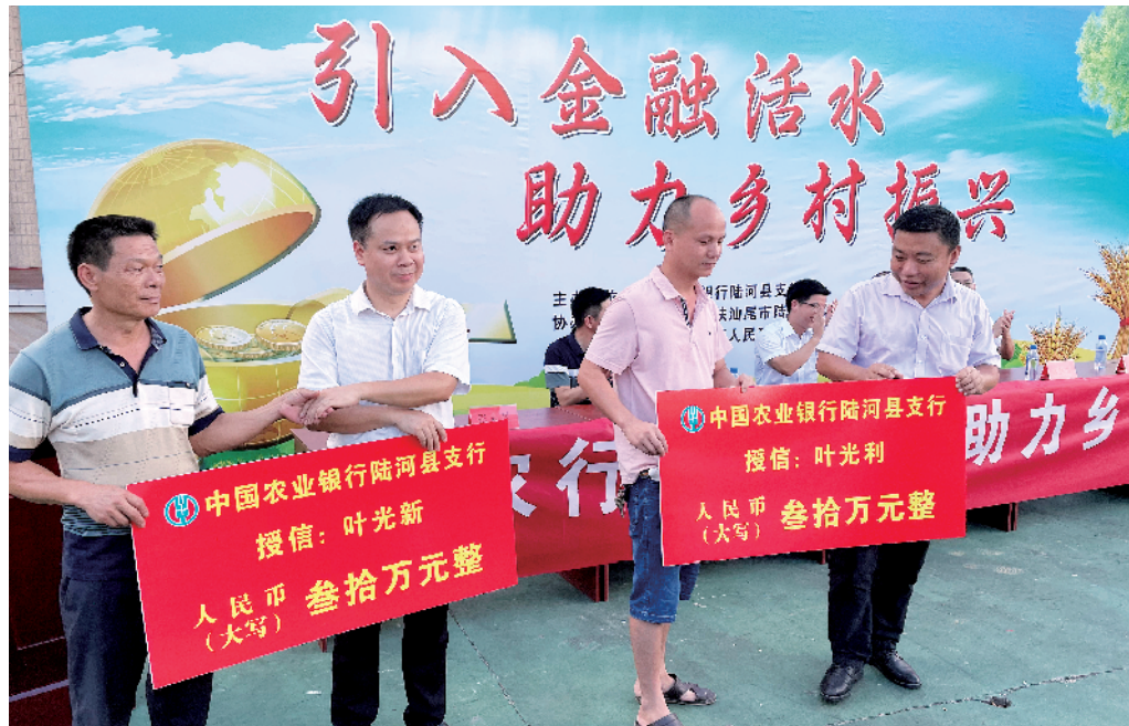
■上护镇的种植户找到了发展资金，获得授信贷款。

进驻两个多月以来，深圳驻汕尾陆河县上护镇驻镇帮镇扶村工作队（下称“驻上护镇工作队”）一直“与时间赛跑”，不仅在半月内完成14个行政村（社区）的走访调研；逐一摸排边缘困难户情况，并制定具体帮扶方案；还针对上护镇农产品种类多品质好但销路窄的现状，采取一系列消费帮扶行动，逐渐探索出适合上护镇的消费帮扶模式，既做好“销售”，解决农户眼前的收入问题，守牢防止返贫底线，又当好“顾问”，为上护镇村民持续稳定增收谋长远之策。