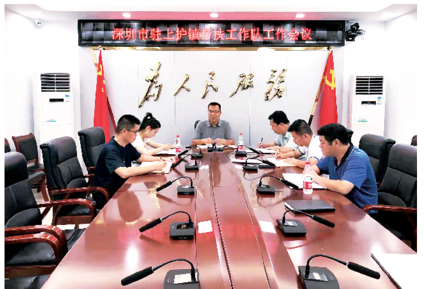
■驻上护镇工作队开会。

“先帮助解燃眉之急，后扶上马送一程，彻底摆脱贫困的枷锁。”驻上护镇工作队认为，帮镇扶村是一个有机整体，要帮到点上，扶到根上，确保守住防返贫底线，方能使乡村振兴取得实实在在的成效。