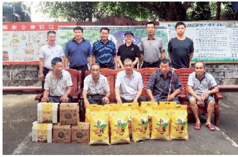
■驻上护镇工作队引入的爱心企业调研并慰问上护镇困难家庭和孤寡老人,送去慰问金和生活用品。