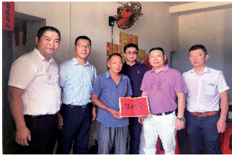
■驻上护镇工作队引入社会力量高效介入,走访慰问返贫监测对象。