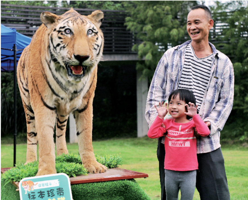
■市民参加宣传月活动。