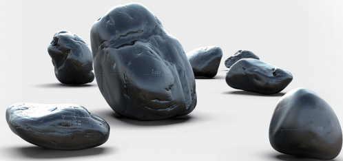
■天工·七合 (一组七件) 2021

万物时空的历程,感觉奇妙,所以经常忘我地观注!近期的创作由考古学和地质学的研究延伸而来,在地质博物馆与实地考察的基础上进一步探究当代水墨的理性思考和观察方式,以及人文视野下的自然观、时空观。深入人文地理学的创作主线,借助水墨独特的艺术语言和表现方式,将文化、地缘学研究与历史考古相结合,经过反复研究当地地质博物馆的藏品和文献资料,将采集样本、水墨图像与文献材料相结合,寻找新的表达方式,慢慢建构自己的艺术语言和创作的制作方法,从而尝试突破二维的作品逻辑,在三维与多维之间拉开维度。