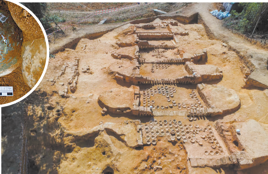
■白马窑址群局部航拍图。

新快报讯 记者黄闻禹 通讯员粤文旅宣 朱奕凡报道 11月12日,2021年海上丝绸之路保护和联合申报世界文化遗产城市联盟联席会议在宁波举办。新快报记者获悉,广东省惠州市在会上签署了《海上丝绸之路保护和联合申报世界文化遗产城市联盟章程》,标志着惠州市正式加入“海丝申遗城市联盟”。截至目前,广东共有广州、潮州、汕头、江门、阳江、湛江、惠州7个城市已加入海丝申遗城市联盟。