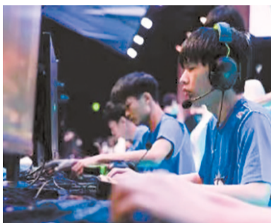
■UP英雄联盟分部选手在比赛中。