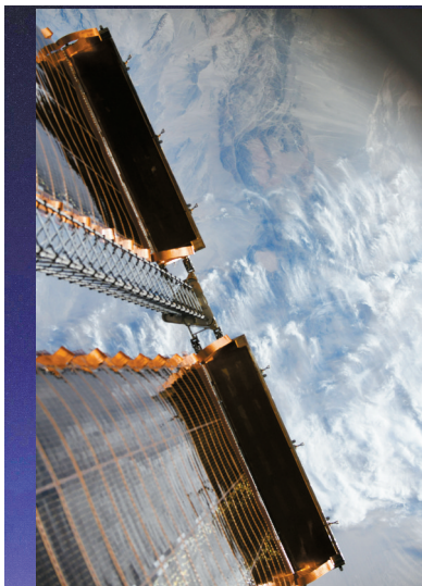
■这是航天员王亚平在中国空间站组合体内拍摄的地球的画面。