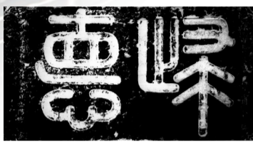
■明 广州“归德”城门石额