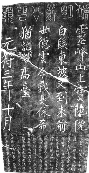
■苏轼题灵洲宝陀寺诗碑拓片