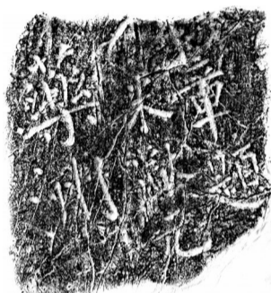
■米芾题“药洲” 宋熙宁六年(1073年)