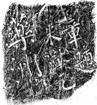
■米芾题“药洲” 宋熙宁六年(1073)