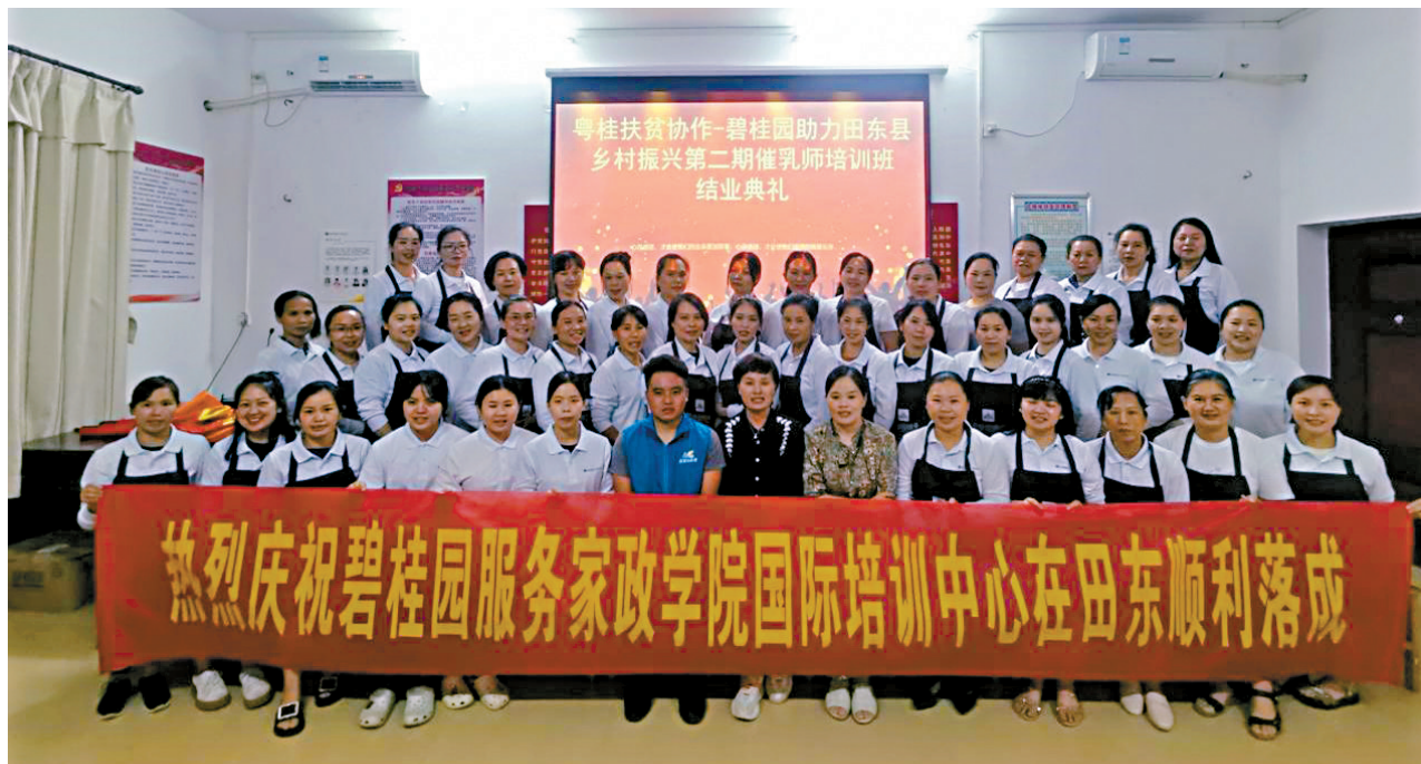
■碧桂园田东县催乳技能培训举行结业仪式。