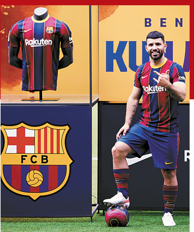
■5月31日,阿圭罗亮相巴塞罗那诺坎普球场。