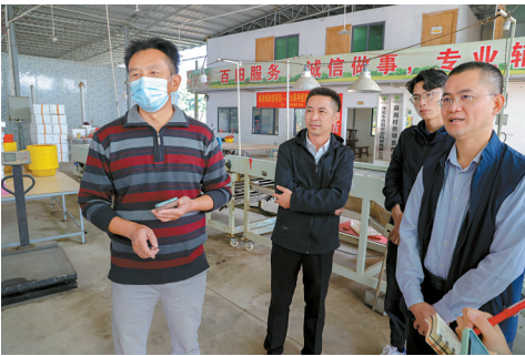
■经营圣女果基地的茂名市百田农业公司，依托“公司+农户”的种植模式，一直指导麻岗镇周边农户种植千禧圣女果。