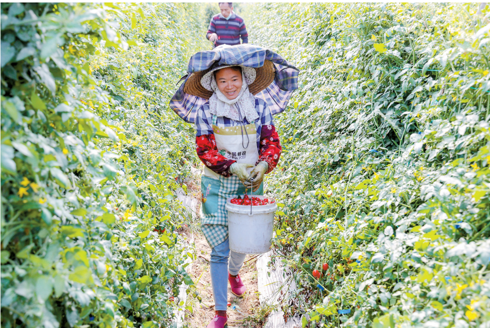
■ G228 国道附近的麻岗镇麻岗洋村，初冬暖阳照在一片圣女果基地上。火红的果实一串挨一串，在翠绿的藤叶间若隐若现，远远望去，煞是好看。这是一种叫“千禧”的圣女果，因为甜度更高，是市面抢手品种。

乡村振兴开局，国家税务总局广东省税务局、国家管网华南分公司组成的驻镇帮镇扶村工作队（下称工作队），正扎根热土，捉住温泉、农业等“特”字元素深度整合，纵深连接乡村农家，激活新动能。