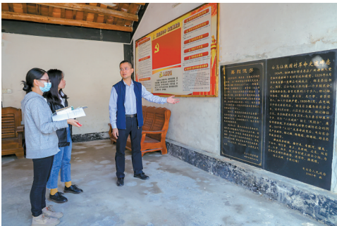
■位于电白区中部沿海地区的麻岗镇，不仅有温泉和圣女果，镇上资源丰富，基础完善，中共南路革命先驱邵贞昌烈士的故里也在这里。