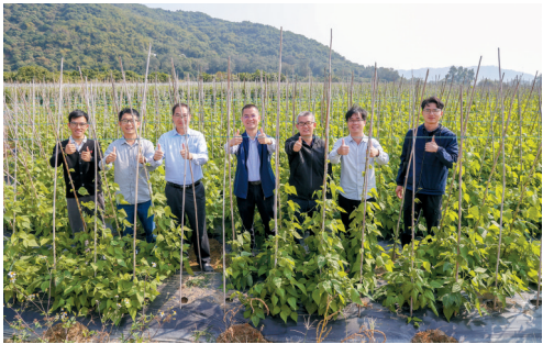
■国家税务总局广东省税务局、国家管网华南分公司组成的驻镇帮镇扶村工作队，捉住麻岗镇温泉、农业等“特”字元素深度整合，纵深连接乡村农家，激活新动能。