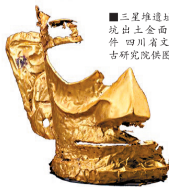
三星堆遗址5号坑出土金面具残件