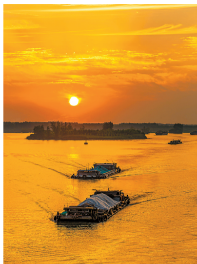
■大运河江苏邳州段的“黄金水道”

2021年的选题也让我感慨，我们在洞察时代现象时具备一种持续而独立的思考的重要性，这有助于对核心问题的捕捉和判断，即将对象放在一个流淌的时间序列中，看它的成分、位置 and 变化，以此为前提的研究和论断是有力量的，也是可信的。关于每期选题，它的价值尚没有完全发挥出来，一组文章只是开了个头，读者的再讨论、再写作，都值得汇聚起来促成真正的对话。一个月一期选题、一本杂志，是一种无休止的运行状态，其工作的当下意义是显现的，但看向未来，难免有更长远意义的期待，这也是我今年不断自我追问的问题。