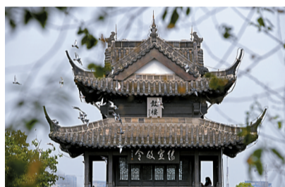
■大运河江苏高郵孟城鼓楼