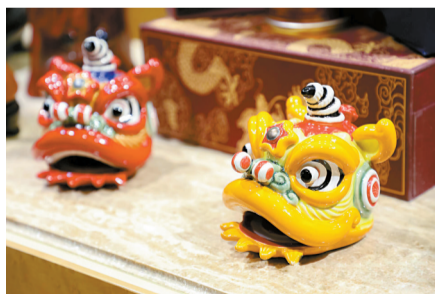
■“湾区(广州)文创节”上的文创产品2