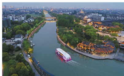
■大运河扬州段夜景