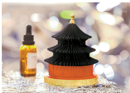
■“湾区(广州)文创节”上的文创产品

什么是青春？青春是少年，是满眼的阳光，是那怎样都睡不够的午觉；是在敞亮的教室里记不清楚的数学公式；是认真的放肆与任性，都是青春最独特、最真实的样子。今年，努力搭建了2021首届“湾区（广州）文创节”。在这里，博物馆IP衍生品、非遗工艺、服饰与家居品牌、广东本土老字号、艺术品等悉数登场，让我看到属于传统文化的“青春”。