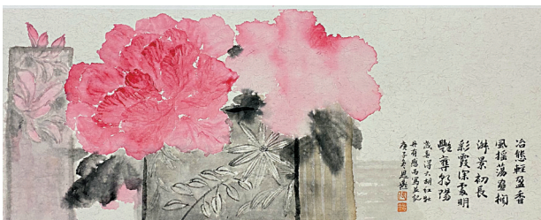
■张思燕《明艳夺朝阳》2021年