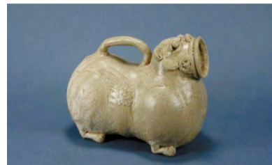
■三国时期的青瓷虎子

两汉至隋唐墓中,常见一种有提梁的伏虎形器和一种有提梁的圆体形器,考古报告通称之为“虎子”,认为是男性用的溺器,俗称夜壶。