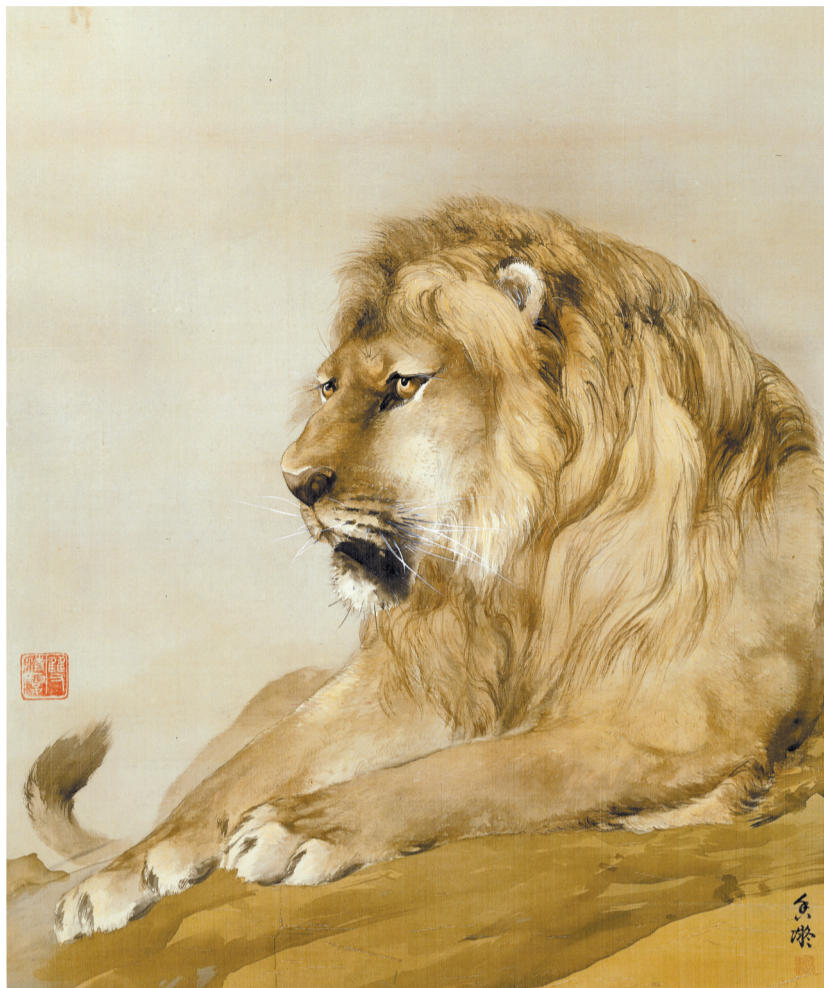
■何香凝《狮》1914年 何香凝美术馆藏

最后一个是同辈画家的影响。19世纪末20世纪初动物画的时兴,得益于当时博物科学的发展。与何香凝同时期赴日游学的高剑父,素有“高老虎”之名,是虎画推广的重要人物。高氏的虎画自1906年至1914年在广州、上海、杭州、南京等地相继展出,虎画变成了国内收藏市场的新宠,以至于“画虎高于真虎价”。何香凝的虎狮猛兽相继创作于这段时间。由此,也就出现了廖恩焘乐于将弟媳何香凝的虎画赠予收藏家这一雅事了。