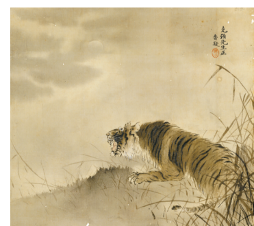
■何香凝《虎》1910年 何香凝美术馆藏

三是求真。何香凝的狮虎画,尤其是虎画,在革命时代是一个精神象征和信念寄托。在她的实际生活中,虎画常作为赠礼画运用于艺术社交之中,对像她这样一位画家来说具有一定的现实意义和实用价值。