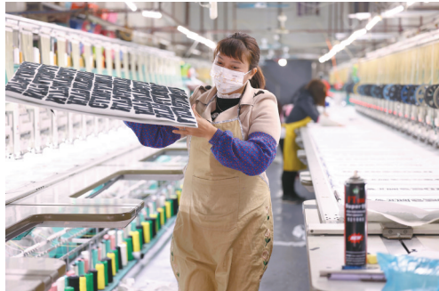
◀工厂只有在赶订单的时候才需要更多的工人,所以厂里招的基本都是临时工,对于工人来说只需要掌握好一门手艺,努力成为熟手,哪里都能找到工作。