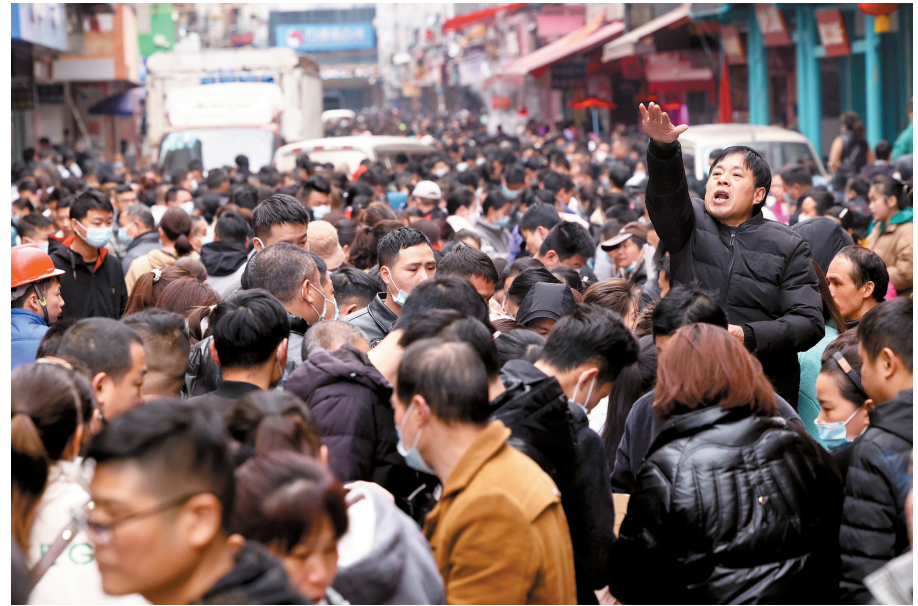
▲因为人流拥挤,一名招工者干脆站在电单车上吆喝,吸引更多工人注意。