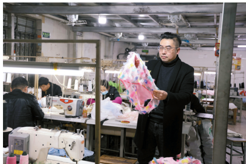
◀服装厂的杨老板从正月十一就开工,为了赶今年的第一笔订单,这两天他一直在忙着招工,随着疫情的好转,对于今年的行情杨老板满怀信心。