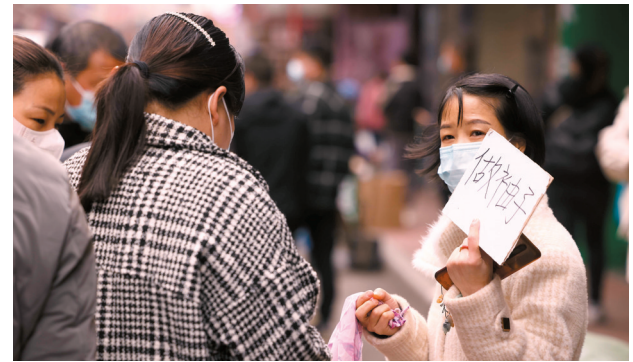
▶因为是流水作业,每个工人都有自己的强项,招工者只需要在牌子上写上简单的工种就能让人一目了然。