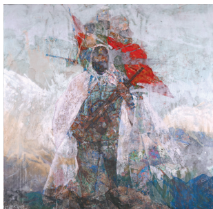
■银奖作品 刘卓明《丰碑》综合材料绘画 180cm×180cm