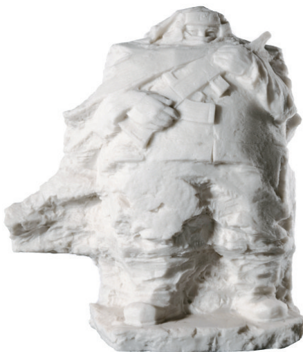
■新文艺群体·金奖作品 李雄、何扬波、朱灿华《戍边英雄》雕塑 58cm×30cm×66cm