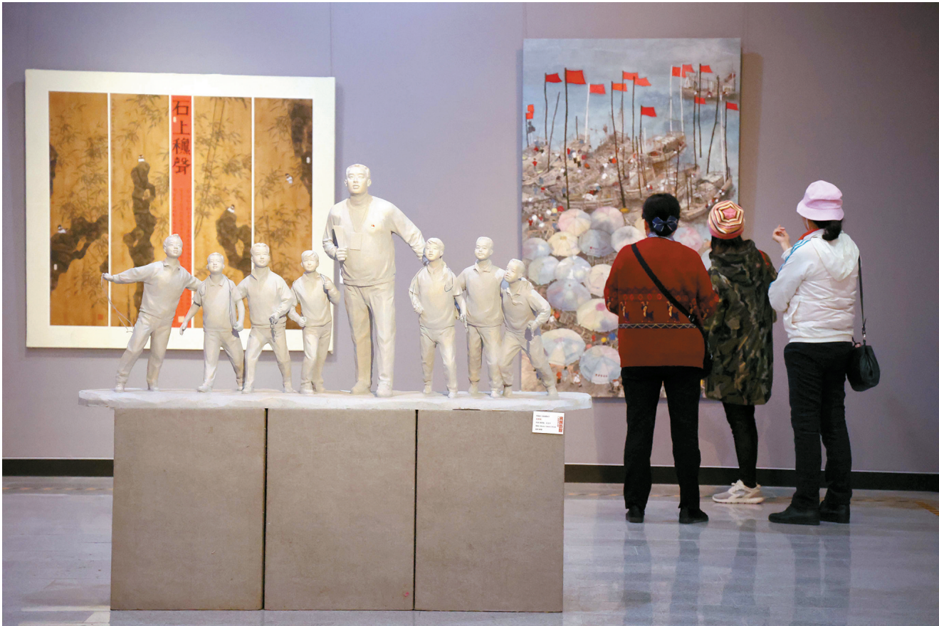
■“光辉历程——广州美术大展”现场。