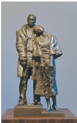
■特邀作品 广州市美协顾问唐大禧《周文雅与陈铁军》雕塑 29cm×17cm×61cm