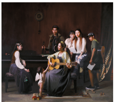
■银奖作品 余荣《梦想开始的地方》油画 145cm×130cm