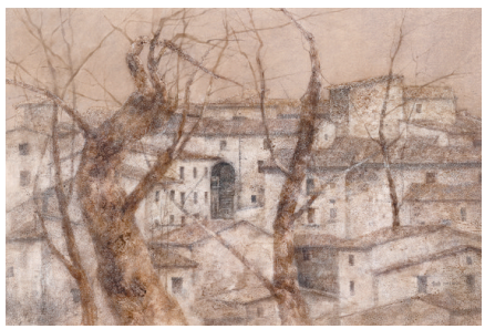
■新文艺群体·金奖作品 钱朝勇《晨曦》纸本水彩 103cm×68cm