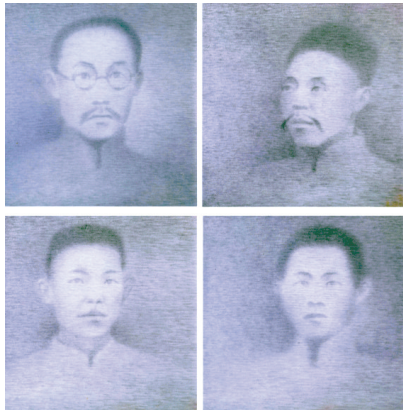
■银奖作品 蒋志勇《共产党人——何叔衡、董必武、王尽美、邓恩铭》