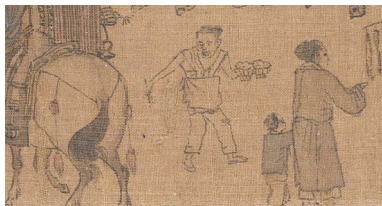
■“这个送外卖的小哥已经是熟练工了。”