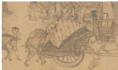
▲屏风上的草书大字被用作货车的苫布