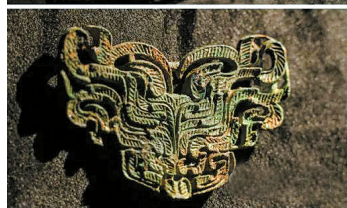
■浙江衢江西周高等级土墩墓群庙山尖土墩墓出土部分青铜器