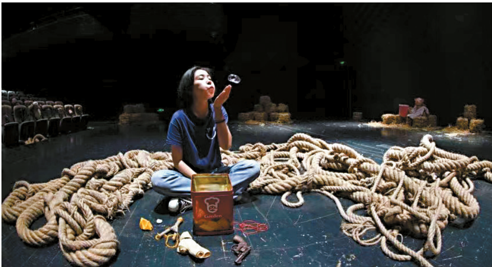
▲《存在与时间2.0》,只有一个观众的剧场表演。