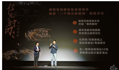
▼《存在与时间2.0》导演介绍剧目。