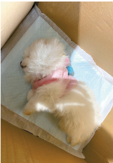
■七七购买的博美犬已经病死。受访者供图