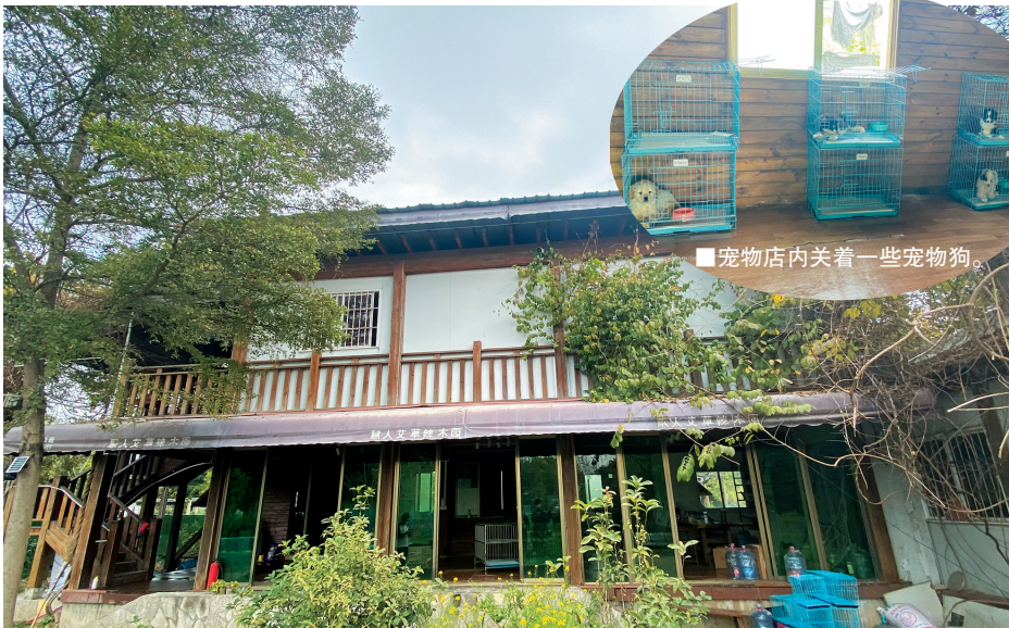
■涉事宠物店未悬挂招牌和营业执照。