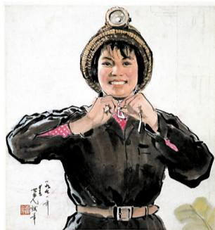
■杨之光《矿山新兵》1971年