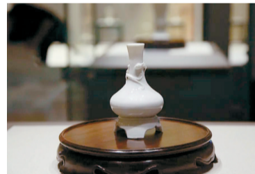
■德化窑白釉瓷连座荸荠瓶

明代,当一件件来自古老东方的神奇器物漂洋过海去到欧洲,被展示在各个达官贵人面前时,人们纷纷惊叹于器物的如脂似玉、造型的独具匠心。当他们被告知,这些器物的产地源自“中国”这个神秘国度时,“Blanc de Chine”——“中国白”这个代表着属于中国独有的、象征高洁等优秀品格的颜色专有词汇诞生了。