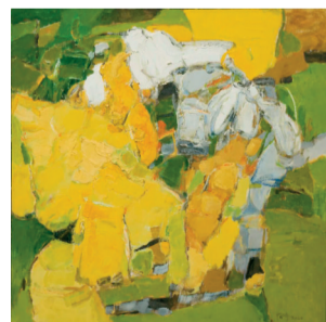
■何坚宁《光·作品3号》2020年

时间:2022年3月1日-3月20日 地点:广州美术学院昌岗校区美术馆1、2、3号厅