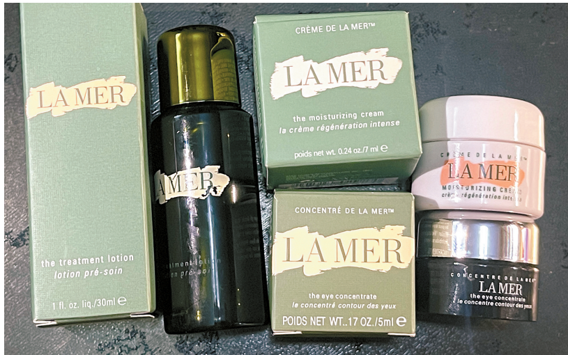
■记者点开推送进入“优品严选购”商城购买了199元的海蓝之谜套装。