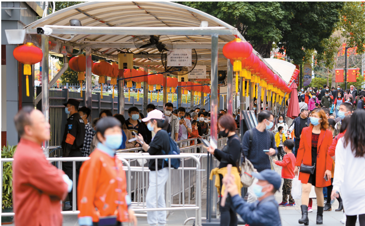
■2022年春节期间,广东省博物馆西门,观众排队领票进馆。