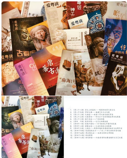
■有观众在网上售卖广东省博物馆免费发放的刊物。